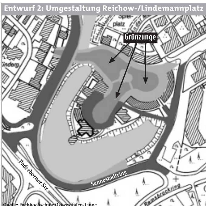
Entwurf 2: Umgestaltung Reichow-/Lindemannplatz

Grüne Mitte: In diesem Entwurf werden beide Teiche ebenfalls enger aneinander geführt, um die „Insel“ zu betonen. Ein Großteil des Platzes wird Rasen. Entlang des Häuserrunds auf dem Reichowplatz bleibt genügend Fläche für den Markt, die Zufahrt dazu beziehungsweise zur Tiefgarage wird hinter den Reichowplatz gelegt.