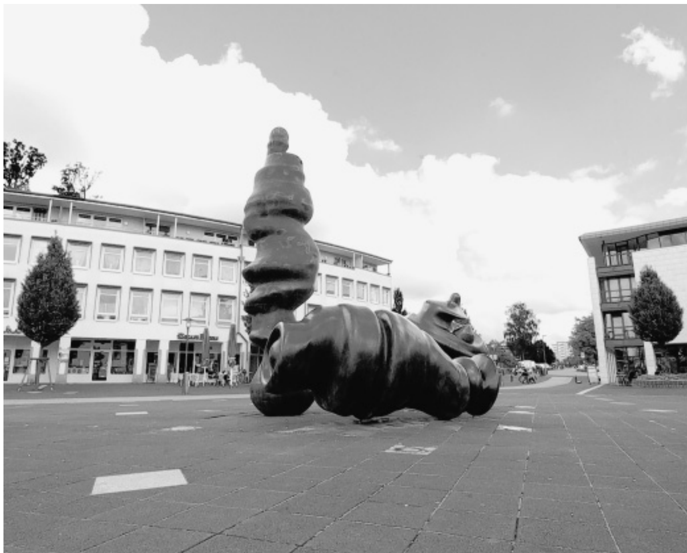
Planungsproblem: Zu wenig Grün, zu wenig belebt, zu wenig abgegrenzt, meinen die Detmolder Studenten zu Sennestads Zentrum. Und bringen eine Fülle neuer und bekannter Verbesserungsideen – mit und ohne Kunstwerk „Auf der Lichtung“.

■ Ummeln. Der Ummelner Ortsverband im Sozialverband Deutschland (SoVD), dem ehemaligen Reichsbund, lädt seine Mitglieder sowie Interessierte am kommenden Montag, 16. Februar, wieder zu einem Kaffeetrinken mit Pickertessen ein. Die Veranstaltung beginnt um 16 Uhr im Café Bürenkemper in der Ladenzeile an der Gütersloher Straße.