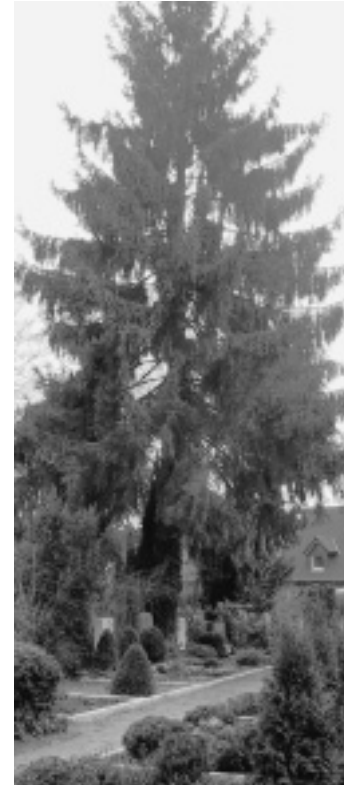
Zieht Vögel an: Die 20 Meter hohe Fichte auf dem Friedhof.