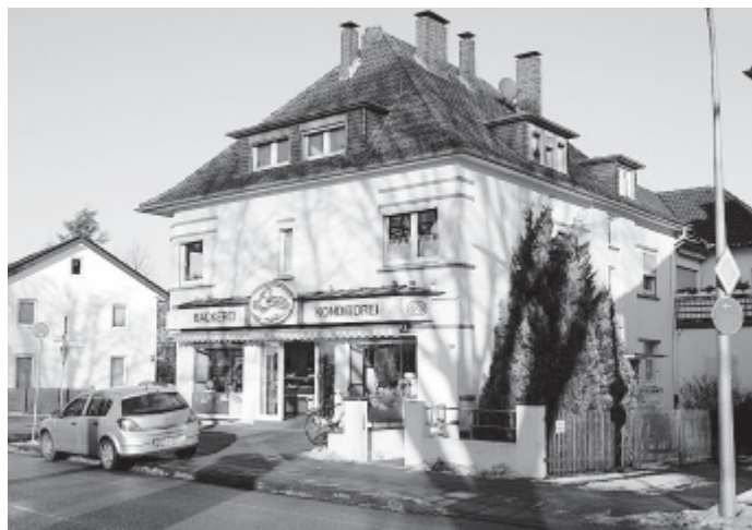
Anordnung aus Detmold: 15 Meter Halteverbot vor der Bäckerei Lamm an der Sudbrackstraße.