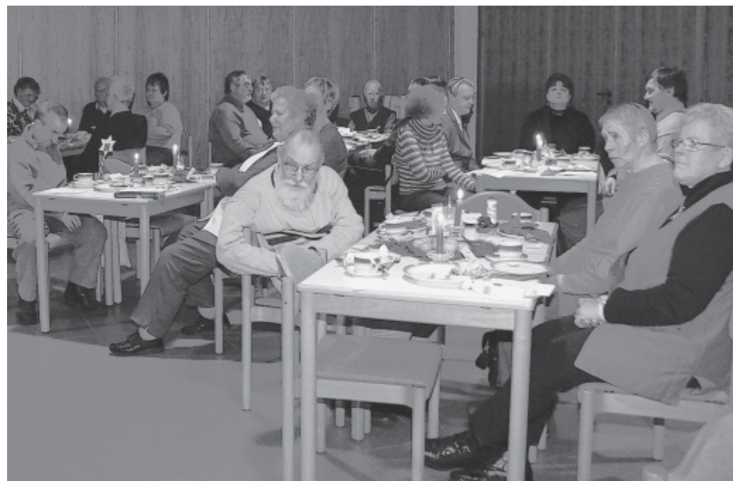
Heiligabend-Stimmung: Wie jedes Jahr seit 1994 trafen sich knapp 40 Menschen im Bartholomäus-Gemeindehaus, um gemeinsam den 24. Dezember zu feiern.