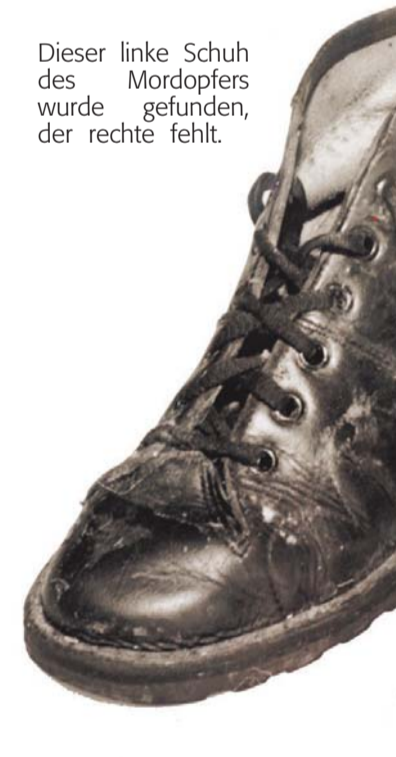
Dieser linke Schuh des Mordopfers wurde gefunden, der rechte fehlt.

Bielefeld (WB/uko). In einem »Exzess«, so das Bielefelder Schwurgericht, haben zwei Männer einen Drogenabhängigen mit 108 Messerstichen getötet. Konsequenz des Landgerichts: zehneinhalb und elfeinhalb Jahre Haft gegen die Angeklagten wegen eines gemeinschaftlichen Mordes. Beide waren wegen Alkohol und Drogen nur vermindert schuldfähig. Sogar die Füße des 24-jährigen Deutschrussen waren in den Morgenstunden des 24. September 2008 durchstochen worden. Die Leiche wurde danach von den beiden Angeklagten und einem Mitwisser in einem Weiher im Norden von Bielefeld versenkt. Dieser dritte Mann wurde im Laufe des Prozesses als mutmaßlicher weiterer Täter verhaftet, das Oberlandesgericht Hamm hat ihn vor einer Woche aus der Haft entlassen. Die Gründe für seine Beteiligung seien nicht schlüssig.